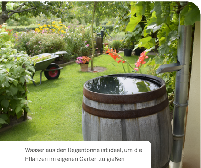
Wasser aus den Regentonne ist ideal, um die Pflanzen im eigenen Garten zu gießen

Als „große Alternative“ zur Regentonne können Sie einen unterirdischen Behälter, eine sogenannte Zisterne, in Ihrem Garten installieren. Das Wasser wird über eine Pumpe entnommen und kann ebenfalls zur Bewässerung im Garten genutzt werden.