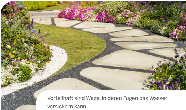
Vorteilhaft sind Wege, in deren Fugen das Wasser versickern kann